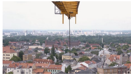
ÜBER DEN DINGEN Florian Schurz

FEST · Nikita Diakur · DE · 2018 · 2' 55" ÜBER DEN DINGEN · Florian Schurz · DE · 2017 · 13' 12" ARRIVAL · Falk Hoysack · DE · 2017 · 5' 15" A DAY AT THE CAMP · Oscar Aubury, Paolo Jacob · FR · 2017 · 10' 39" WAVES · Vojtech Domlatil · CR · 2017 · 3'