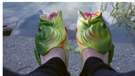
THINGS AND WONDERS 2022 Anna Vasof

STUFF AS DREAMS · Guli Silberstein · GB · 2016 · 5' ARRIVAL · Falk Hoysack · DE · 2017 · 5' 15" THE STOP · Dorota Proba · PL · 2018 · 5' 57" RESISTANCE · Laurence Favre · CH · 2017 · 11' THINGS AND WONDERS 2022 · Anna Vasof · AT · 2017 · 4'