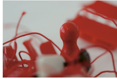
HALMASPIEL Betina Kuntzsch

DEMIAN · Marc Sebastian Eils · DE · 2017 · 9' 30" THE STOP · Dorota Proba · PL · 2018 · 5' 57" HALMASPIEL · Betina Kuntzsch · DE · 2017 · 15' POLISH WOMEN ON STRIKE · Kasia Prus · PL · 2016 · 3'